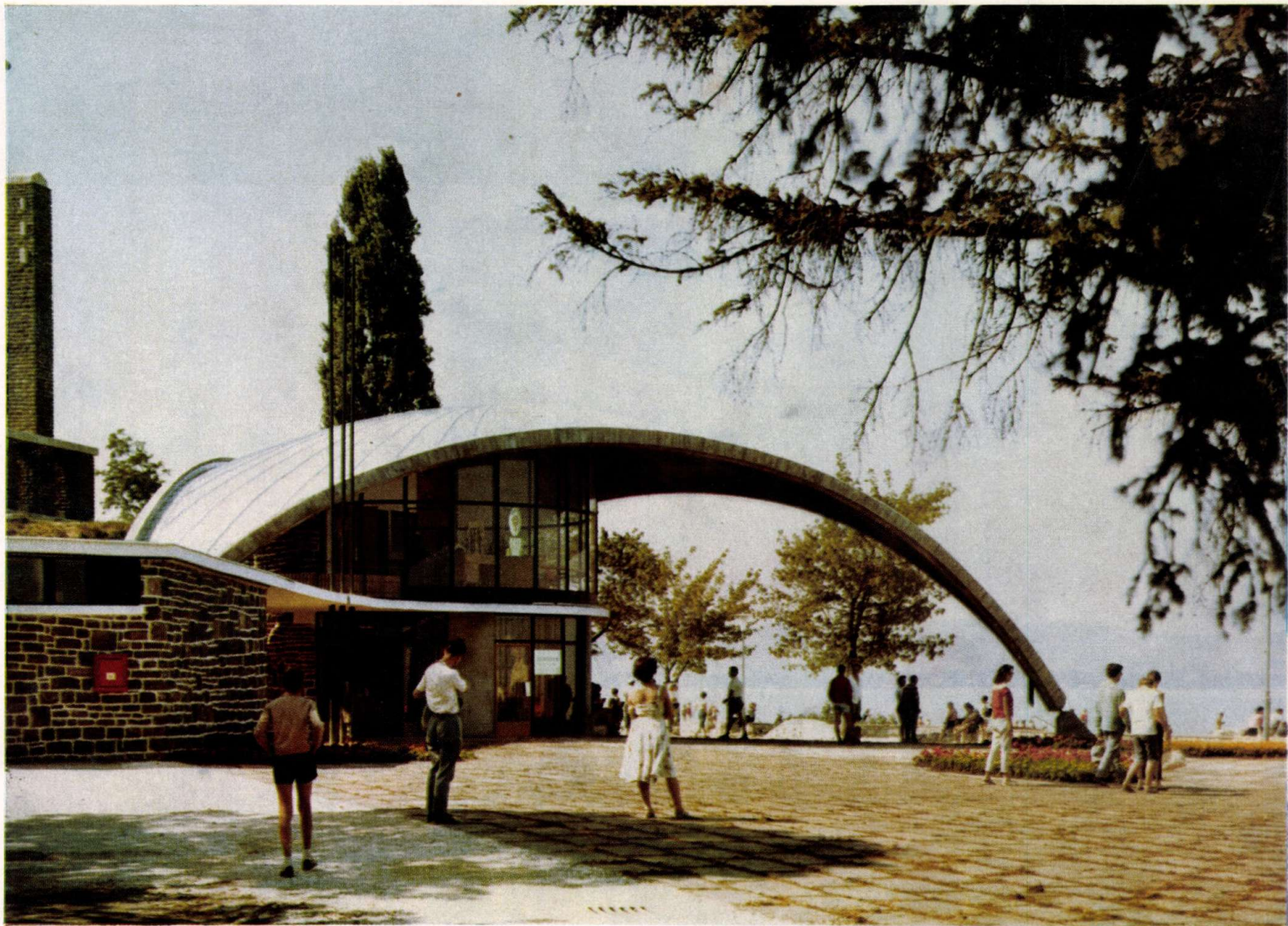
Posta és Idegenforgalmi Iroda. Építész: Bérczes István, KÖZTI, Szittyá Béla, IPARTERV, (Foto: MTI)

Építész: Bérczes István, Szittyá Béla (IPARTERV)